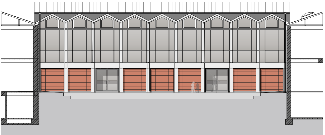
Ansicht von Norden