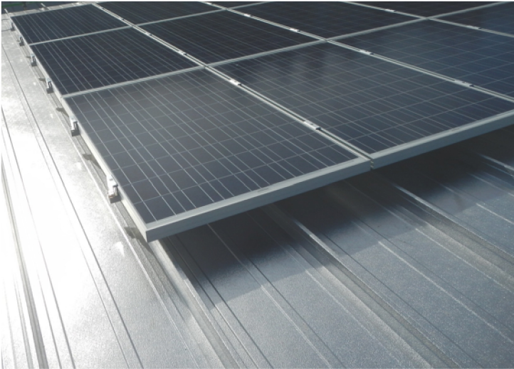
Detailaufnahme der neu errichteten Photovoltaikanlage

Bauherr: Landeshauptstadt München, Baureferat Architekt: Boschmann + Feth Architekten GmbH Leistungsumfang: Lph 2-5 n. HOAI Fertigstellung: November 2012 BGF: 2 Sporthallen je ca. 350qm Gesamtkosten: ca. 650.000 EUR Umbau: im laufenden Betrieb Versammlungsstätte, Gesamt 500 Pers.