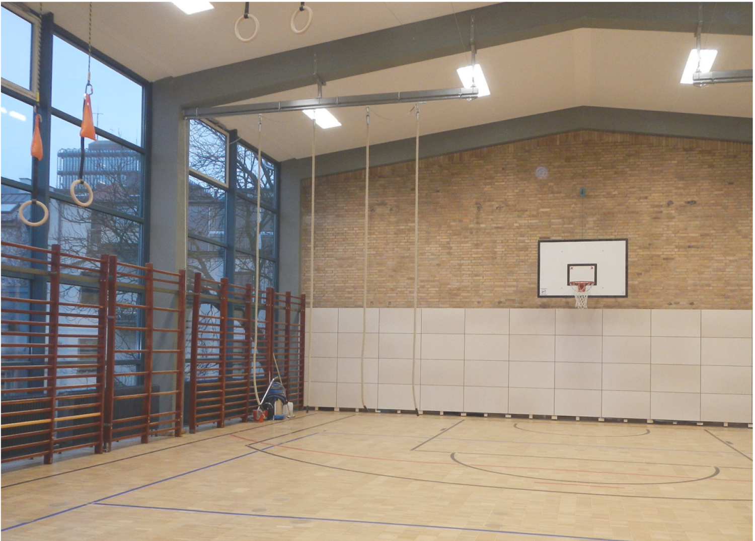
Sporthalle 1.OG nach der Sanierung